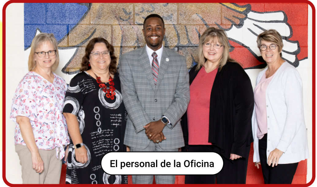
El personal de la Oficina