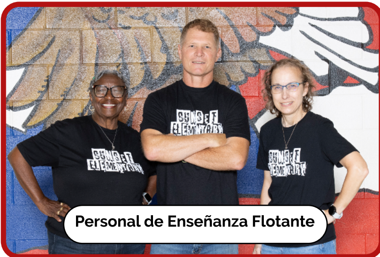
Personal de Enseñanza Flotante