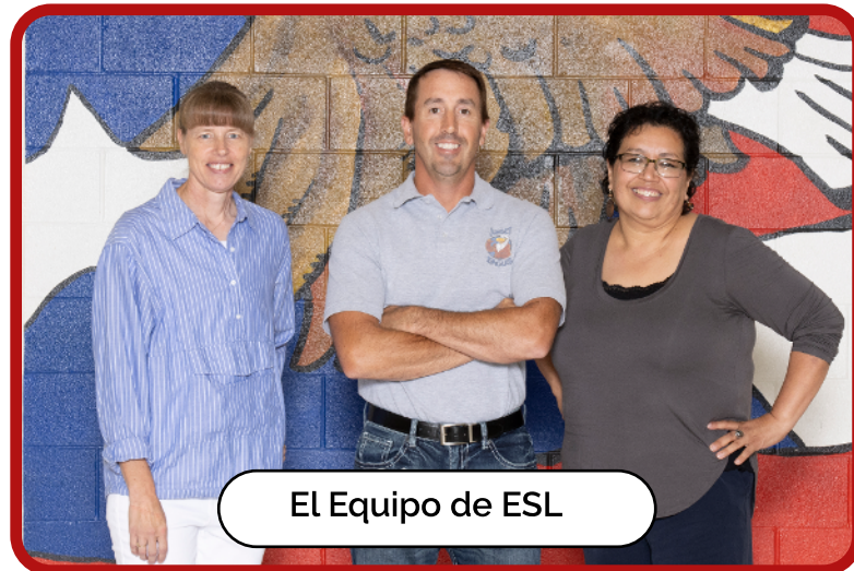
El Equipo de ESL