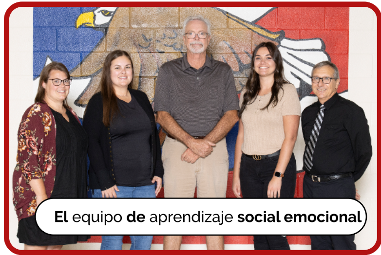
El equipo de aprendizaje social emocional